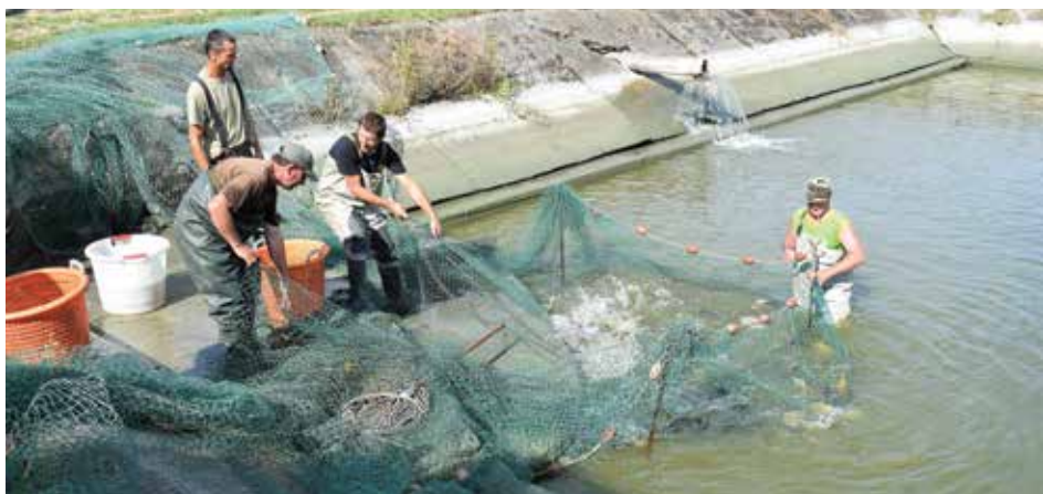
A szubextenzív termelés nem rontott a ponty minőségén

pedig 30 hektárnyi tóba egyáltalán nem jutott víz. Mindkét káresemény tanulságait levonva tavaly még okszerűbben gazdálkodtak, ami ez esetben azt jelenti, hogy rendszeresen mérik a vízminőséget, a meglévő vizet pedig nagy becsben tartják. Mindez persze a termelési eredményeken is meglátszik, hiszen a megszokottnak alig több, mint a fele lett a lehalászott „haltermés”.