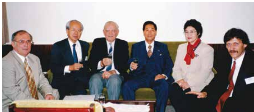
1996 szeptember Szemirámium Budapest Hotel: Az NSZSZ 1996-ban Budapesten rendezte meg az éves halászati szemináriumát

gödöllői Agrártudományi Egyetemet kitüntetéses oklevéllel végezte, míg a doktori iskolát Summa cum laude minősítéssel zárta. Az agráregyetemet agrármérnöki diplomával 1964-ben fejezte be, ám a '70-es években további két szakdiplomával is bővítette a tudását: 1972-ben sikeresen vizsgázott a halgazdálkodási, 1975-ben a vadgazdálkodási szakokon is. A doktori címet 1982-ben kapta meg, a disszertációját a „Növényevő halak tartósítása gyorsfagyasztással” címmel védte meg.