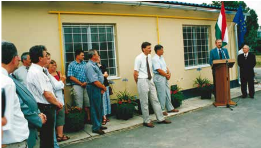
A gyomaendrődi halfeldolgozót Németh Imre földművelésügyi miniszter adta át 2004-ben

hata, amit szeretett. Hitvallása, hogy úgy kell végezni a munkánkat, hogy azzal másokat is segítsünk. Minden körülmények között becsüljük meg a másik embert! Az utókornak pedig azt üzeni, hogy legyen bátorságuk, kitartásuk, erejük az álmaik megvalósításához. És éljék át azokat az élményeket, amelyeket Tóni bátyám is meg- és átélt a Tisza folyón és a Tisza mellett.